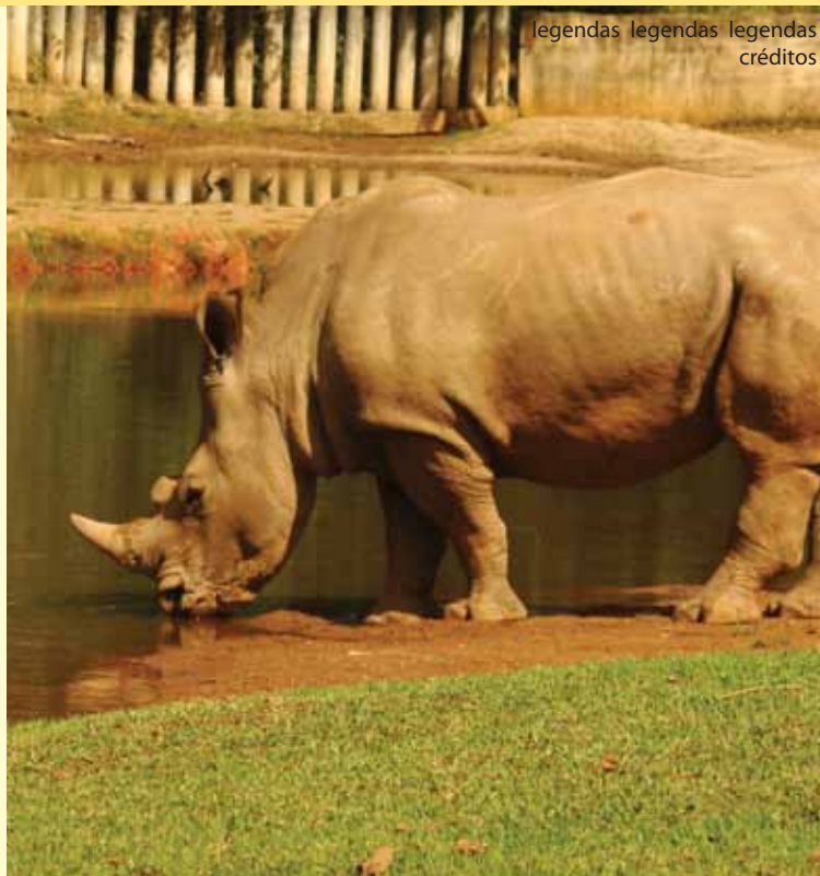
legendas legendas legendas créditos

É difícil encontrar no Brasil uma estrutura de parques tão bem montada como esta. Não é à toa que eles vivem lotados. Chegue cedo e corra para a fila dos brinquedos mais procurados. Se for com crianças pequenas, vá direto para as áreas dedicadas a elas, onde normalmente há menos gente, e o clima é mais sossegado. Lembre-se que não é permitido entrar com comida nos parques e só se consome o que for comprado lá.