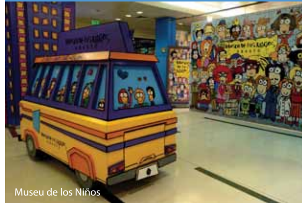
Museu de los Niños

O Museu de los Niños , no shopping Abasto , ( www.museodelosninos.org.ar ) oferece um ótimo passeio por corredores cheios de jogos e experiências interativas, apresentações teatrais e muita diversão.