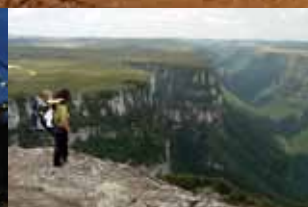
CÂNIONS DO SUL