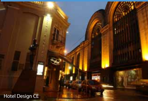
Hotel Design CE

Os hotéis-butique viraram onda na cidade, e há opções das mais simples aos templos de luxo. Para aproveitar a tendência, conheça o Hotel Design CE ( www.designce.com ), em plena região central. O edifício restaurado tem quartos espaçosos e o hotel oferece café da manhã 24 horas por dia.